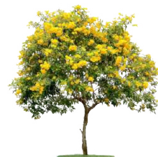
Ipê Mirim tecoma stans

Áreas verdes sociais com Ipês Mirim e Jasmin Manga, em um ambiente com espaços confortáveis e sombreados.