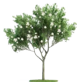
Ligustro ligustrum lucidum

Utilizando o conceito de conservação criativa, a vegetação foi selecionada para corresponder a seus diferentes papéis no ambiente e na paisagem. Todas as vias planejadas pensando no efeito da floração (beleza intensa das flores) incluindo Ligustros e Acácias.