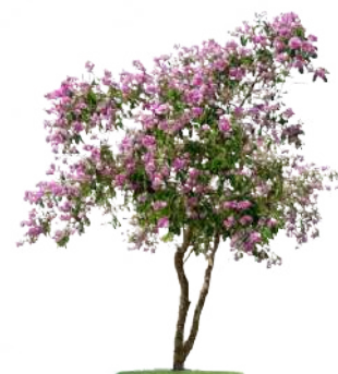
Jasmim Manga plumeia rubra