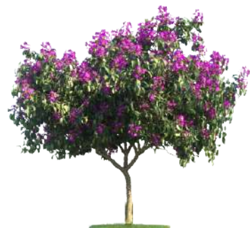
Quaresmeira tibouchina granulosa